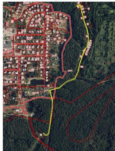
Ситуационный план M 1 : 7000